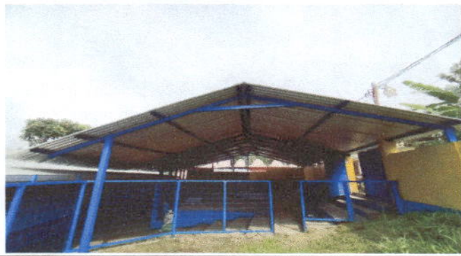
Foto1: CUBIERTA DE LAMINA Y ESTRUCTURA DE TECHO