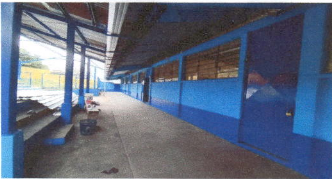
Foto 3: Mantenimiento a estructura (lijado, cambio de tubo , cepillado, sujetaciones, aplicación de pintura)