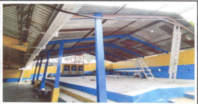
Foto 6: Sustitución de canal de metal Y Sustitución de bajada de agua pluvial de metal por tubo PVC 3"

Observación: Si es necesario se pueden agregar hojas adicionales y agregarle número de hojas.